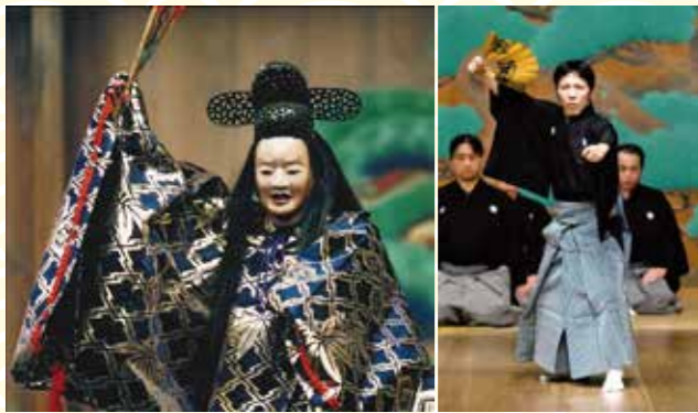
出演者舞台写真